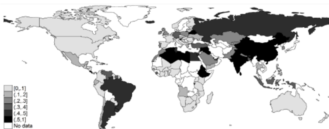
Figure 1.2. Share of assets owned by government banks, 2010

Notes: The map reflects 2010 data, except for the MENA region where 2008 figures are used instead.