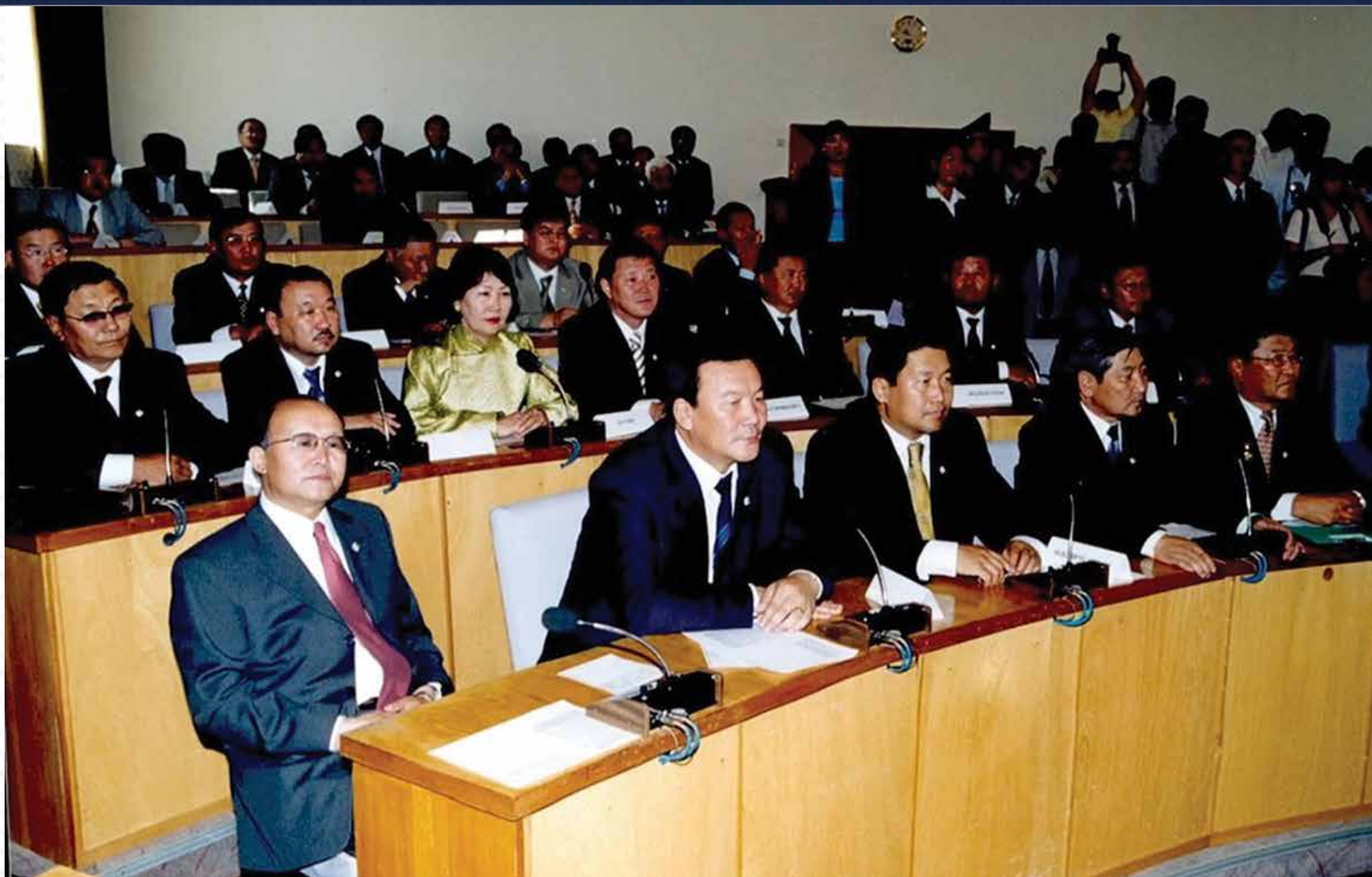
УИХ-ын гишүүд чуулганы нэгдсэн хуралдааны танхимд