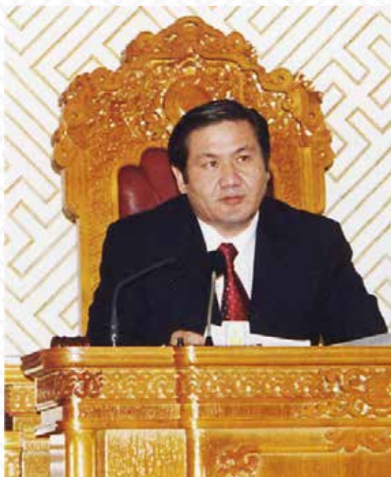
УИХ-ын дарга Н.ЭНХБАЯР