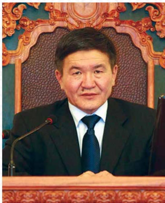
УИХ-ын дарга Ц.НЯМДОРЖ