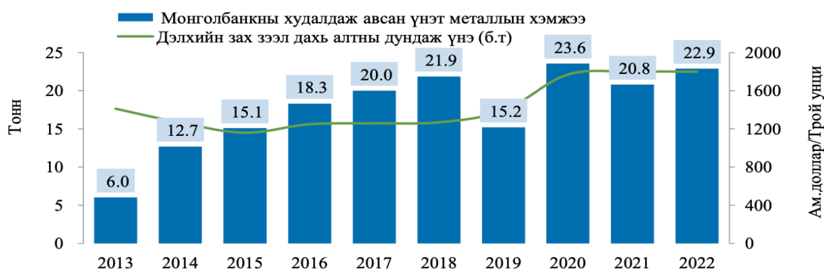
Зураг 1. Монголбанкны худалдан авсан алтны хэмжээ

Монгол Улсын гадаад валютын улсын нөөц 2022 оны эцэст 3,400.0 сая ам.долларт хүрсэн нь 2021 онтой харьцуулахад 22.1 хувиар буурсан үзүүлэлттэй байна.