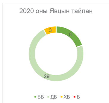
Зураг 3. Монгол Улсын 2020 оны ФАТФ-ын 40 Зөвлөмжийн үнэлгээ