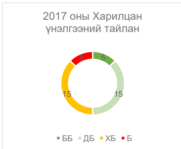
Зураг 1. Монгол Улсын 2017 оны ФАТФ-ын 40 Зөвлөмжийн үнэлгээ