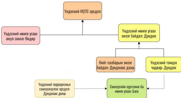
Зураг 5. Үндэсний эрсдэлийн үнэлгээ 2021 ерөнхий үр дүн

Үндэсний эрсдэлийн үнэлгээ нь мөнгө угаах аюул заналхийллийн үнэлгээ, мөнгө угаах эмзэг байдлын үнэлгээ, терроризмыг санхүүжүүлэх эрсдэл болон санхүүгийн хүртээмжтэй бүтээгдэхүүний эрсдэл гэх дөрвөн үндсэн хэсгээс бүрдэнэ. Мөнгө угаах, терроризмыг санхүүжүүлэхтэй тэмцэх тогтолцоонд банк, үнэт цаас, даатгал зэрэг зохицуулалттай салбаруудын аюул заналхийлэл, эмзэг байдлыг харгалзан үзсэн. Үндэсний тэмцэх чадварын үнэлгээ нь хууль эрх зүйн орчин, мөнгө угаах, терроризмыг санхүүжүүлэхтэй тэмцэх чиг үүрэг бүхий төрийн байгууллагуудын чадавх, нөөц бололцоо, бие даасан байдлыг үнэлэхэд чиглэнэ. Монгол Улсын хоёр дахь удаагийн мөнгө угаах, терроризмыг санхүүжүүлэх эрсдэлийн үнэлгээний үр дүнг ерөнхийлөн Зураг 5-д харуулав. Энэ эрсдэлийн үр дүнд үндэслэн Модуль тус бүрийн хүрээнд авч хэрэгжүүлэх арга хэмжээний төлөвлөгөөний төслийг холбогдох ажлын хэсгүүд хамтран боловсруулсан.