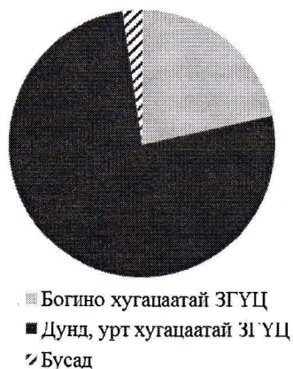
Зураг 3а. Банкууд дахь ЗГ-ын өр төлбөр