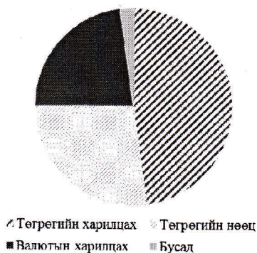
Зураг 1. Төв банкин дахь ЗГ-ын хөрөнгө

Зураг 2-оос харахад, 2011 оны 6 дугаар сараас 2012 оны эцэс хүртэл Монголбанкн дахь ЗГЦЗ-ийн өөрчлөлтийг улсын төсвийн төгрөгийн харилцах дансны өөрчлөлт голлон тайлбарлаж байв. Харин 2012 оны 12 дугаар сард Монгол улсын Засгийн газар 1.5 тэрбум ам.долларын бондыг олон улсын зах дээр амжилттай арилжаалж, тус бондын мөнгө Монголбанкн дахь улсын төсвийн валютын харилцах дансанд орсон нь ЗГЦЗ огцом буурах шалтгаан болжээ. Харин Чингис бондын хөрөнгийн зарцуулалттай холбоотойгоор 2013 оны 5 дугаар сараас 12 дугаар сар хүртэл улсын төсвийн валютын харилцах огцом буурч, ЗГЦЗ-ийн хэмжээ өссөн байна.