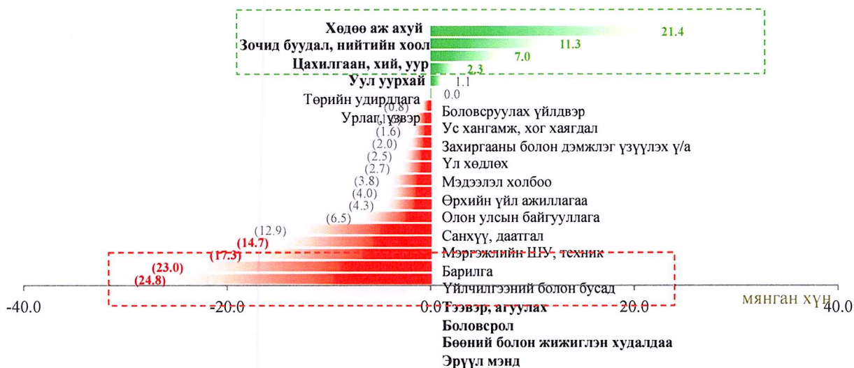
Хүснэгт 3: Ажиллагчид /Эдийн засгийн үйл ажиллагааны салбараар 2015 оноос хойш/ мянган хүн