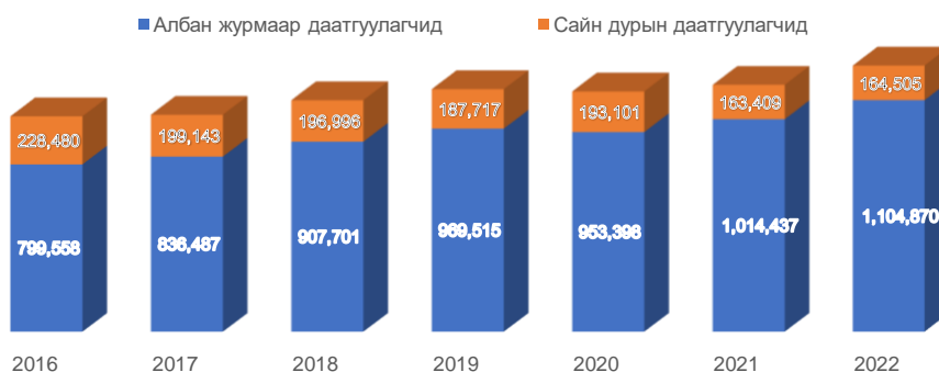
Зураг 1. Нийгмийн даатгалын хамралт, даатгуулагчдын тоо

Зураг 1-т албан журмын даатгуулагчид ерөнхийдөө тасралтгүй өсөж, харин сайн дурын даатгуулагчдын тоо 2016-2019 онуудад буурч, бусад онуудад хэлбэлзэлтэй байна. 2022 онд сайн дурын даатгуулагчдын тоо өмнөх оноос өссөн хэдий ч сайн дурын даатгуулагчдаас төвлөрүүлсэн орлого 2021 оноос 25.8 тэрбум төгрөгөөр буурсан байна.