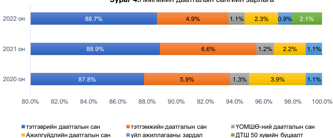
Зураг 4.Нийгмийн даатгалын сангийн зарлага

Ажилгүйдлийн даатгалын сангийн орлогод 2022 онд 53.6 тэрбум төгрөг төвлөрч, тус сангаас 30.5 мянган даатгуулагчид 78.7 тэрбум төгрөгийн ажилгүйдлийн тэтгэмж авсан байна. Мөн ажилгүйдлийн даатгалын сангаас тэтгэвэр авагчдын тоо 4.3 мянган хүнээр өсөж, түүнд зарцуулсан тэтгэмжийн хэмжээ 21.7 тэрбум төгрөгөөр өссөн байна.