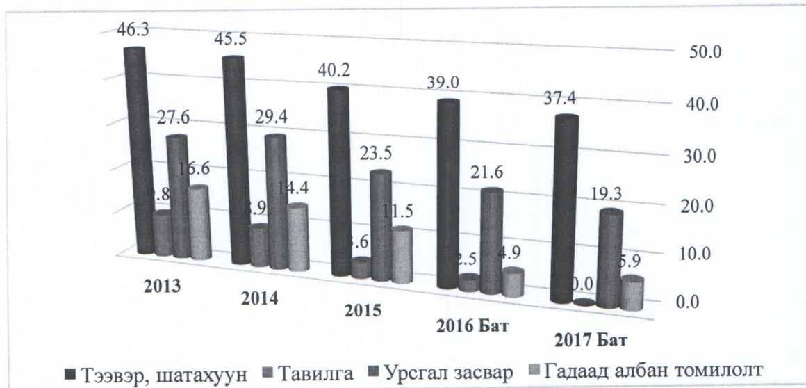
График. Зарим зардлын бууралт. 2013-2017 он /тэрбум төгрөг/

Ингэснээр бичиг хэрэг, тээвэр шатахуун, тавилга ба эд хогшил, нормын хувцас, урсгал засвар, гадаад дотоод албан томилолт, зочин төлөөлөгч хүлээн авах зэрэг зардлуудыг 2013 оноос үе шаттайгаар бууруулсан ба 2017 оны анх батлагдсан түвшнийг 2013 оны гүйцэтгэлтэй харьцуулахад 67.0 тэрбум төгрөгөөр буурсан байна.