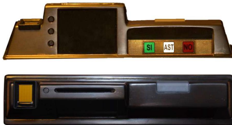
Зураг 3. Италийн Төлөөлөгчдийн танхимын санал хураалтын төхөөрөмж