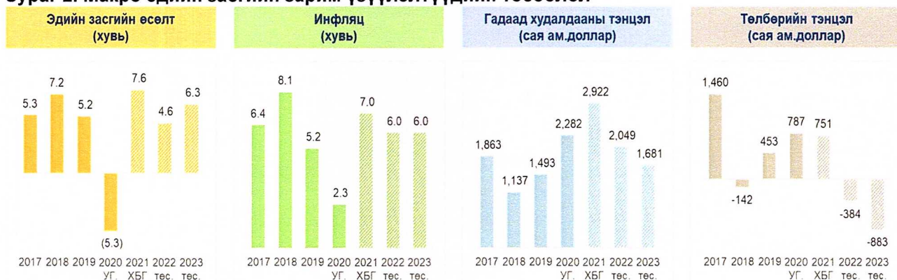
Зураг 2. Макро эдийн засгийн зарим үзүүлэлтүүдийн төсөөлөл

Эдийн засгийн идэвхжил сэргэж, уул уурхай, барилга, боловсруулах үйлдвэрлэл зэрэг салбаруудын үйл ажиллагаа сэргэхээр байгаа нь авто бензин, дизель түлш, барилгын материал, үйлдвэрлэлийн орц, тоног төхөөрөмж, тэдгээрийн эд ангийн импортыг нэмэгдүүлэхээр байна. Ингэснээр дунд хугацаанд гадаад худалдааны ашиг буурч болзошгүй байна.